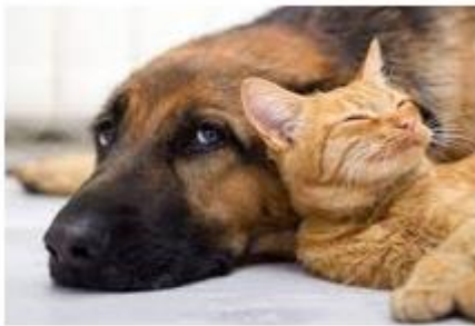
Association AGAPE CHIENS ET CHATS Tunisie

Association L'Arca di Noé in Tunisia Soleiman-Tunisie Mail : stella.fric@yahoo.it