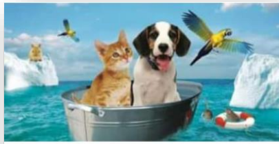
Association l'Arca Di Noé in Tunisia

Association L'Arca di Noé in Tunisia Soleiman-Tunisie Mail : stella.fric@yahoo.it